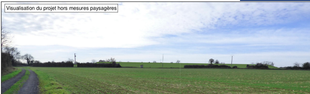
Visualisation du projet hors mesures paysagères

Adaptation des projets aux contraintes de sol : risque karstique et remontée de nappe Prise en compte de contraintes paysagère : digue externe présentant des modelés paysagers